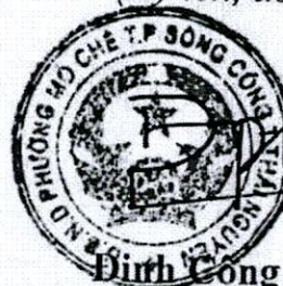
Đinh Công Phương